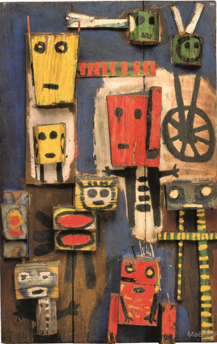
Karel Appel, Questioning children 1949.